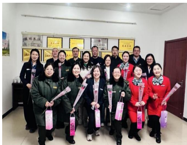
图1 鼎泰集团召开2026年工作会议